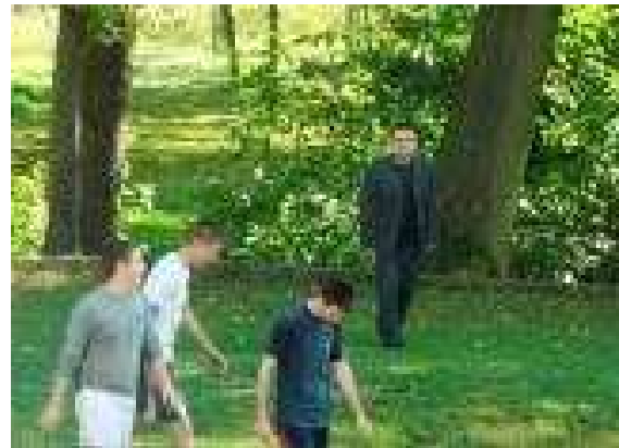
Pan dyrektor w roli sędziego, gwizdek się przydał, oj przydał, tylko strój mało sędziowski!