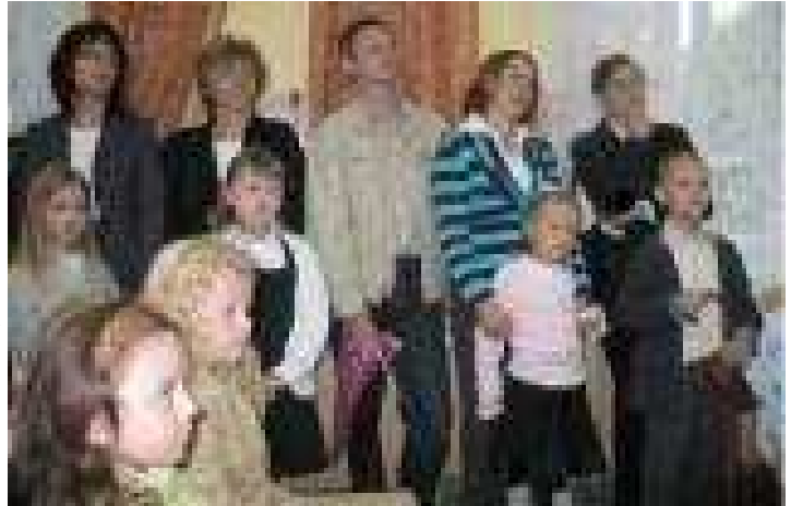
Pierwszaki i ich rodzice podczas akademii z okazji rozpoczęcia roku szkolnego

Po prezentacji wychowawców pan dyrektor życzył wszystkim zebrany powodzenia w nowym roku szkolnym, najmłodszym uczniom szkoły – pierwszacom samych sukcesów.