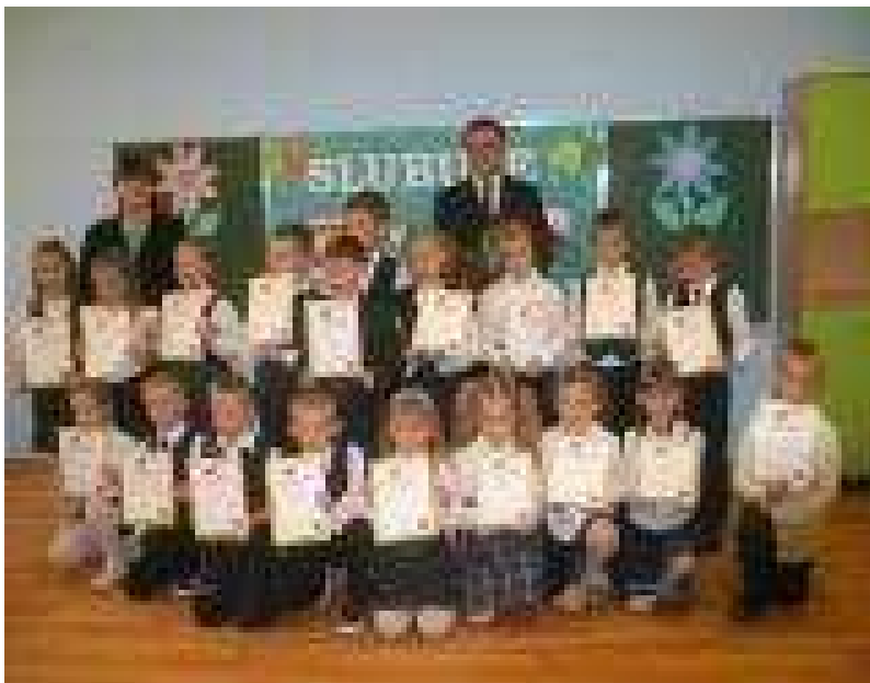
Pierwszaki po pasowaniu demonstrują pamiątkowe dyplomy.

20 października w naszej szkole odbyła się bardzo ważna uroczystość. Otóż w poczet na-