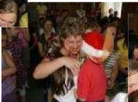
Każda mama otrzymała piękny bukiet CER- TYFIKAT SUPER MAMY , moc buziaków i uścisków!