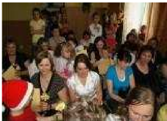
Na twarzach zgromadzonych mam widać było wzruszenie i ogromne przejęcie....

„... każda mama jest najpiękniejsza, najukochańsza, najlepsza na świecie”