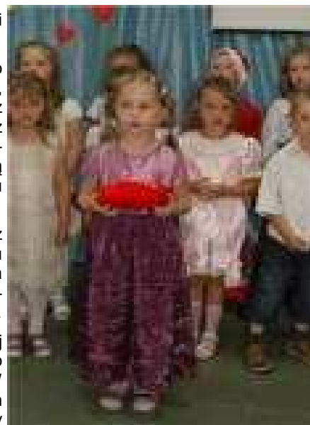
Jakże piękny skarb... serduszko dla mamy

Po inscenizacji przyszła kolej na recytowanie wierszy i śpiewanie piosenek. Dzieci złożyły swoim mamusiom życzenia i wręczyły drobne upominki: bukietek kwiatów oraz Certyfikaty