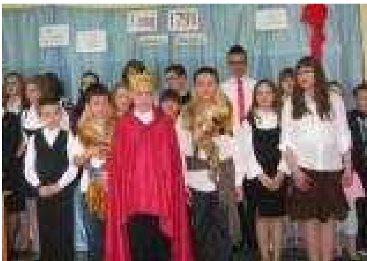
Uczniowie klasy IV i II gimnazjum podczas uroczystego apelu .