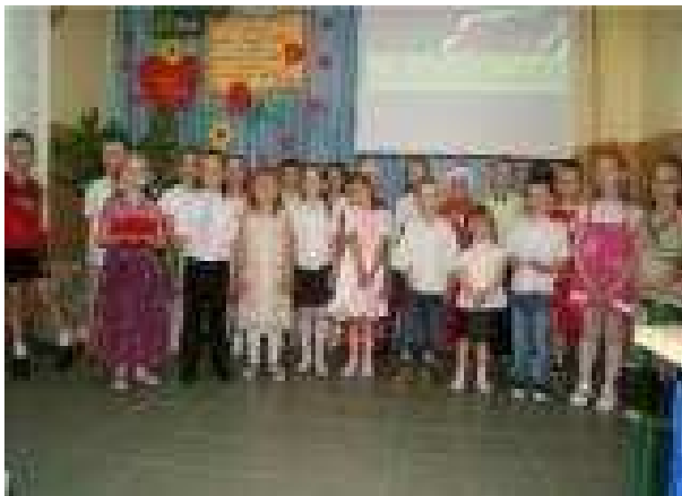
Przedшкоlaki podczas występu dla swoich mam!