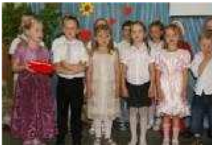
Moc życzeń i gorących serduszek płynęło z ust przedszkolaków dla mam

Dzień Matki to wyjątkowy święto w roku. Tego dnia każda mama jest najpiękniejsza, najukochańsza, najlepsza na świecie. Dzieci bardzo emocjonalnie podchodzą do tego święta, każde chce sprawić swojej mamie