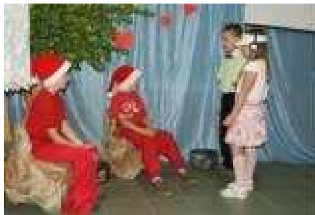
Inscenizacja pt. „Ukryty skarbu” w wykonaniu przedszkolaków...