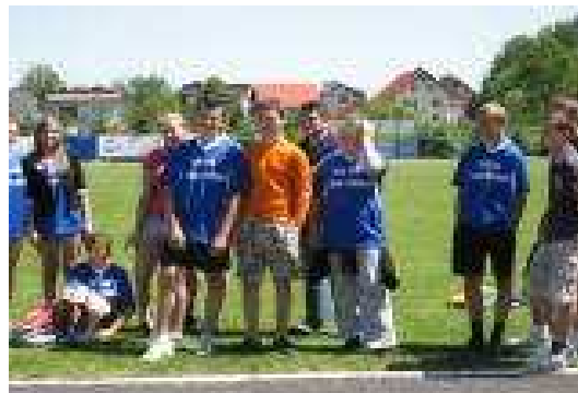
Drużyna z naszej szkoły w oczekiwaniu na wyniki.