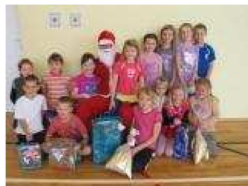
Klasa I SP