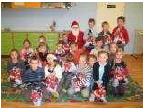
Klasa II z Mikołajem

Po wizycie w przedszkolu Mikołaj udał się do klasy I i II SP. Porozmawiał z dziećmi, popytał pań nauczycielek, czy uczniowie byli grzeczni. Panie miały wątpliwości względem niektórych chłopców, ale Mikołaj się dał uprosić i tylko chłopców upominał. Rozdał prezenty wszystkim uczniom. Otrzymał też w dowód wdzięczności piękne rysunki.