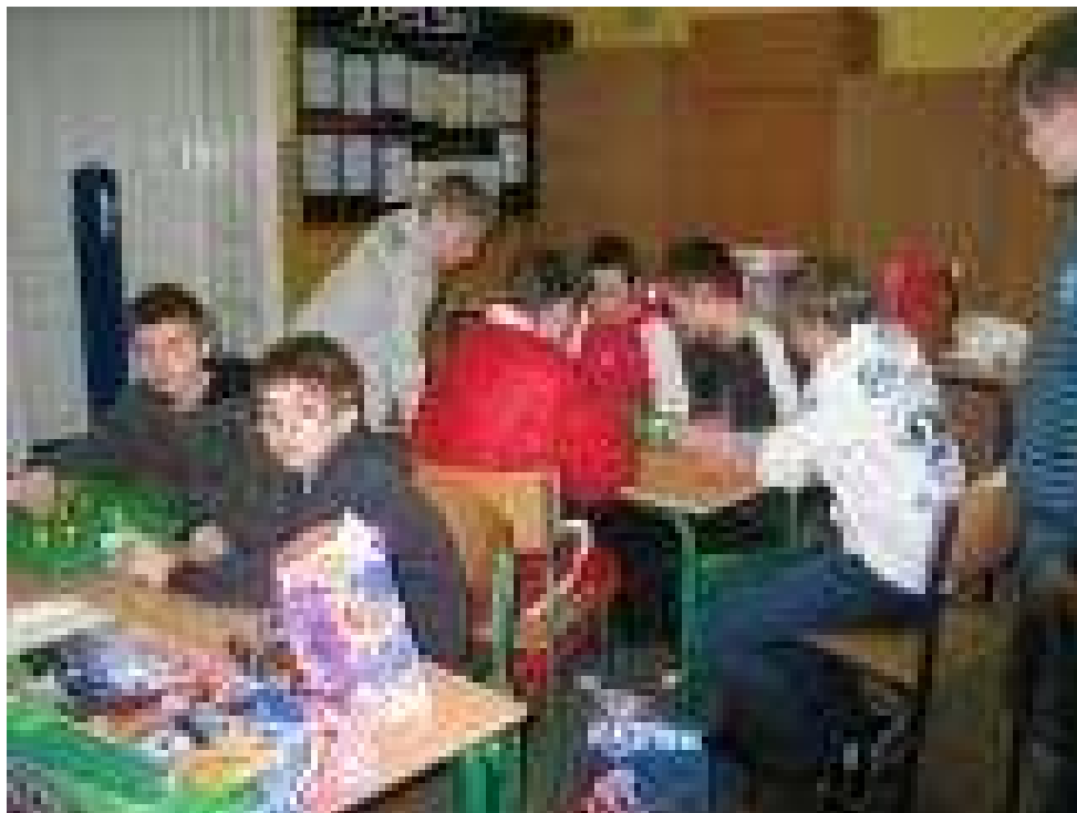
Gra w Football pochłonięła chłopaków bez reszty