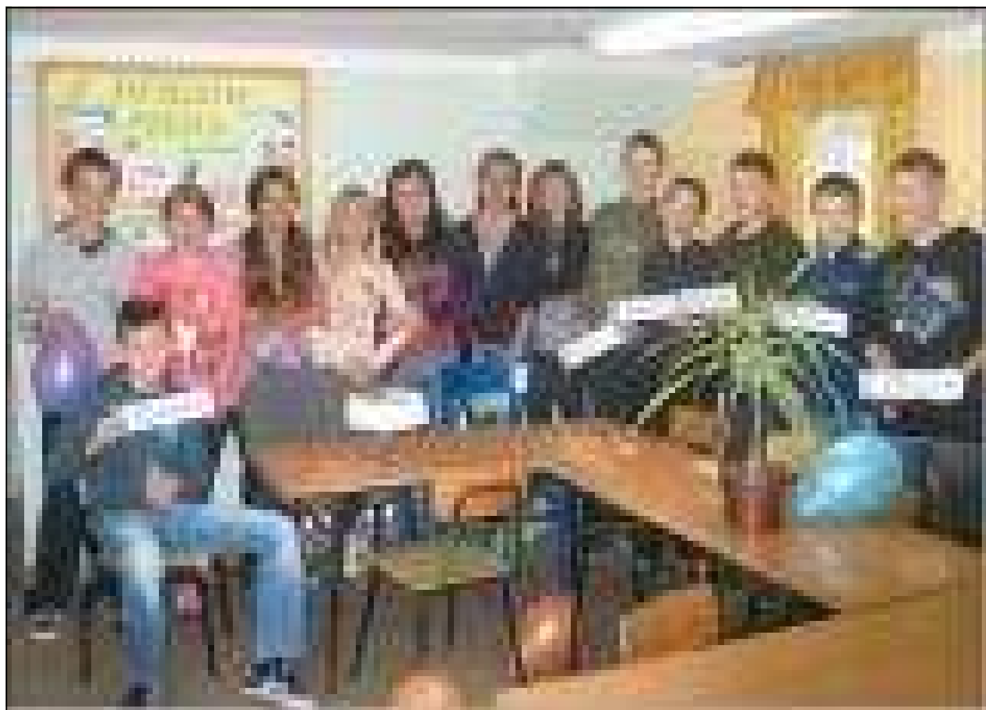
Spotkanie pod choinką w klasie I gimn.